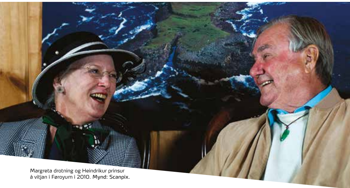
Margreta drottning og Heindrikur prinsur á vitjan í Føroyum í 2010.

So, tað vóru ikki tey mest tespuligu tíðindini, sum merkti forsíðurnar á dagbløðunum, summarið 1967. Tað man tí hava verið ein lætti hjá oddagreinskriaranum, at leggja heimsins stríð og vreiði frá sær eina løtu – og í staðin skriva um eitt av okkara meira dámligu lyndiseyðkennum, kærleikan.