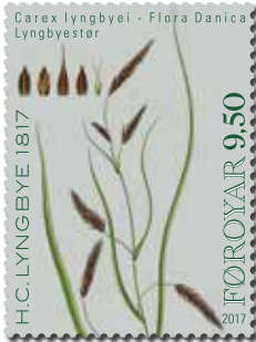
FO 861-864 Royndarprent