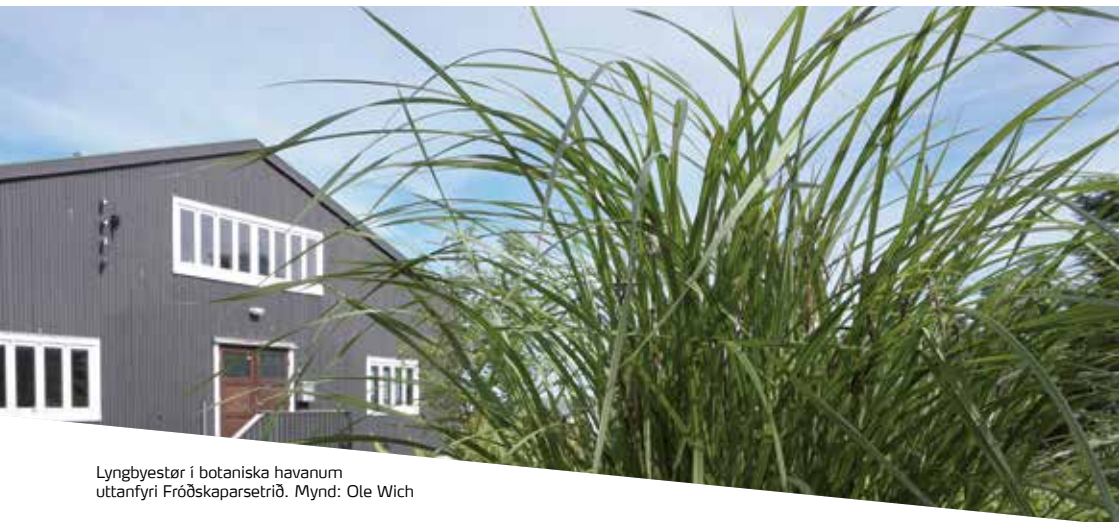
Lyngbestør í botaniska havanum uttanfyrí Fróðskaparsetrið.

hava plántur úr norðuratlantiska økinum við eisini - Føroyum, Grønlandi og Íslandi. Lyngbye fekk fríða ferð við skipunum hjá Kongaliga Einahandlinum og seinni fekk hann stuðul frá einum ríkum vælgerðarfólki og frá Ad usus Publicos grunninum.