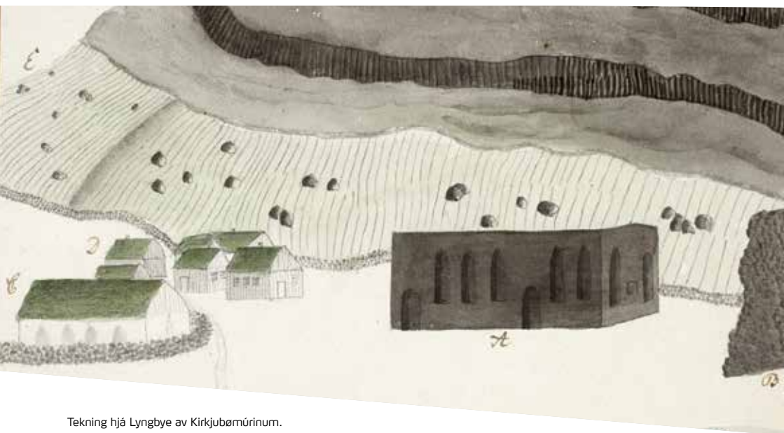
Tekning hjá Lyngbye av Kirkjubørmúrinum.

Vísindafelagnum (Det Kongelige Danske Videnskabernes Selskab). Hann skrivaði eisini ferðafrásagnir. Ein av hesum var um brútleypssiðir í Føroyum og um kvæðini, sum fólk kvóðu og dansaðu til eitt slíkt høvi.