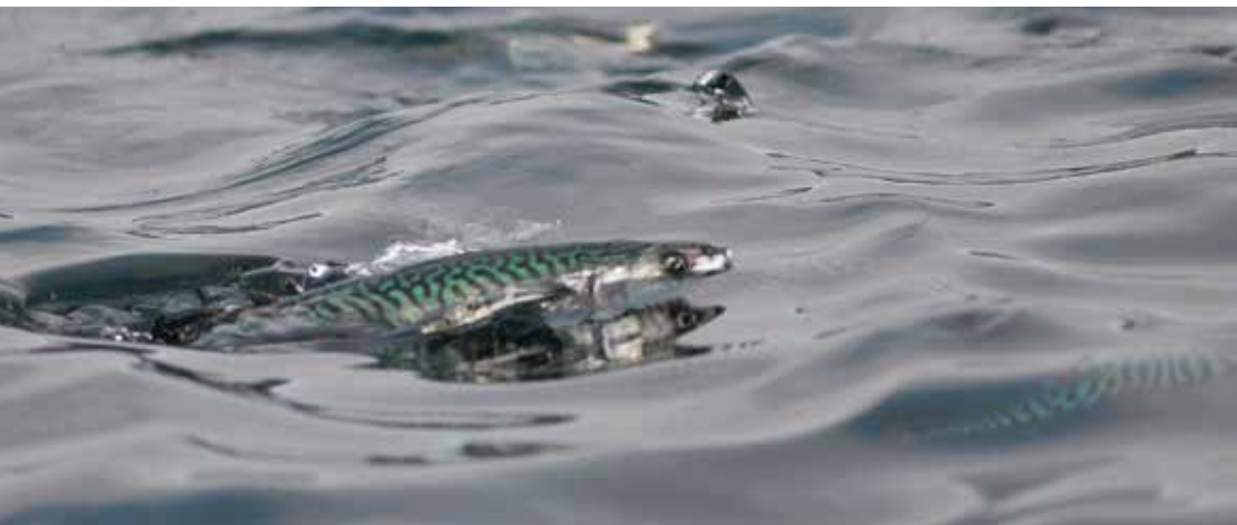
Makrelur í Nólsoyarfirði, 2010.

Tíðliga um summarið etur hann mest reyðæti, seinni um summarið etur hann veingjasniglar og krill. Tá ætið er burtur í sjónum tíðliga um heystið, etur hann nebbasil, brisling o.a.