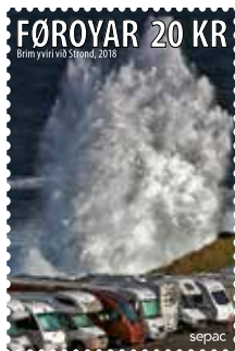
FO 883 Royndarprent