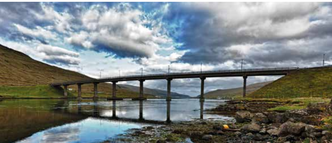
Brúgvín við Streymin.

Sundalagið og árið fyri varð ein byrjing lögð yvir sunðið. Streymoyarmegin lá brúgvarfestið eitt sindur sunnanfyri Langasand, meðan tað eysturoyarmegin lá millum Norðskála og Oyrarbakka. Staðið kallast við Streymin, orsakað av mjækkanum í sundinum, sum gevur harðan streym í sjóvarföllumum.