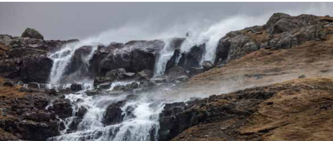
Áirnar fletta upp um seg.

Seinastu tríati árin, hava óvanliga nógvvar ódnir herjað í Føroyum, serliga í novembur og desember. Tað byrjaði við ógvusligu jólaódnini í 1988, sum elvdi til umfangandi skaða, serliga í Havn. Fleiri hús fórust í hvirlunum, húsatekjur flugu langar leiðir og stórir partar av viðarlundunum kring landið vórðu javnaðar við jørðina. Skip og bátar slitu, bátar sukku í bátahyljunum og bilar vórðu so tuskæðir til, at teir ikki gjørdust aftur.