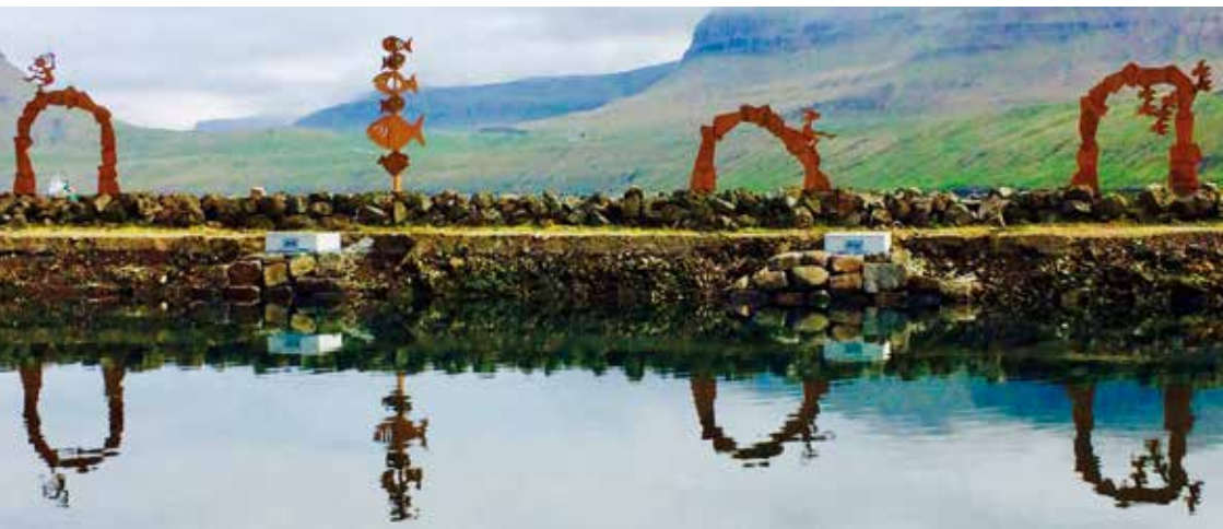
Listaverkið "Portrið til verðina". Mynd: Brynhild Næs Petersen.

Ískorna fjølin er ikki fullkomin, hvørki sum mynstur ella handverksliga. Tó hava vit, við ískorna dupulta bandflættumynstrinum, fingið eitt elligamalt, vøkurt og gátuført mynstur, sum vitnar um ein gerandisdag fyri eini 1000 árum síðani, har brúkslist eisini átti sín part. Sandlíkt er, at landnámsmenn hava havt kistilin ella lutin við sær til Føroya, tó ber eisini til at ímynda sær, at mynstrið kann vera telgt í fjølina niðri við langeldin í húsunum á Oyruni.