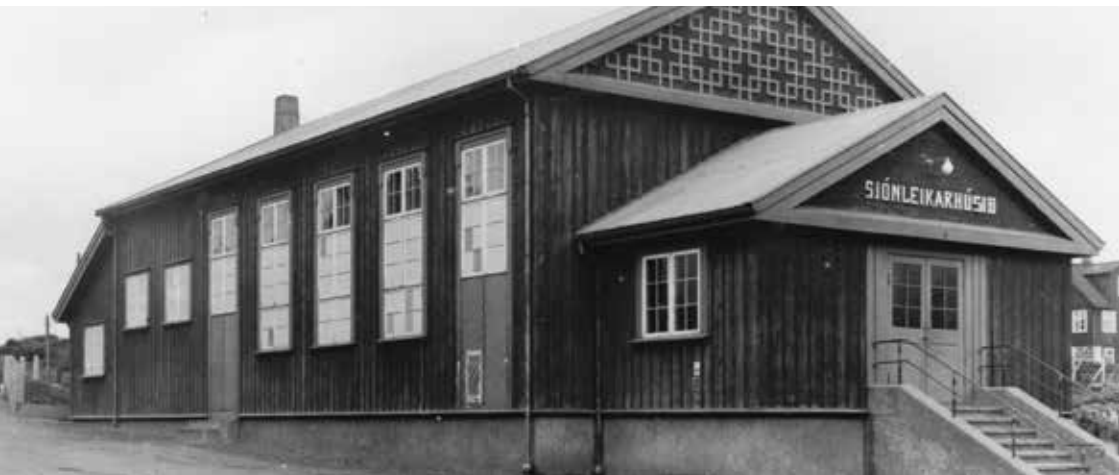
Sjónleikarhúsið í Havn.

sjónleikarhæli burturav. Higartil var spælt í ymsum hølum, serliga Tinghúsinum. Men tað var tvørligt og arbeiðskrevjandi at stilla upp og taka niður millum leikinar.