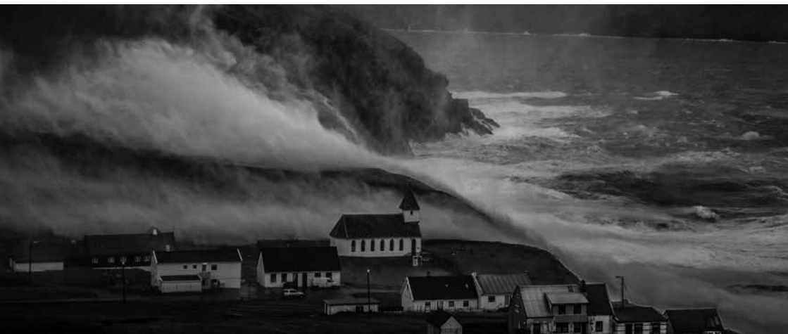
Illveður á Viðareidi í 2012.

Danmark. Til samanlíkingar kann nevast, at harðasta hvirlan av Urð í Danmark, var máld til 37,8 m/sek. - meðan harðasti miðalvindur kom upp á 29 m/sek.