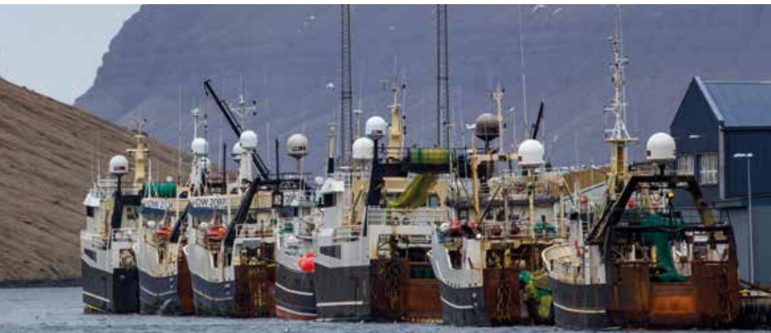
Skip við bryggju í Klaksvík.

Makrelur hefur ongan sundmaga, og merkir tað, at hann kann kava skjótt, og svimja skjótt upp til vatnskorpunu uttan at fáa trupulleikar við trýstinum, altso uttan at fáa kavarasjúku.