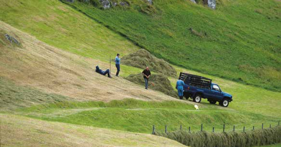
Í hoyna. Foto: Faroephoto, 2014