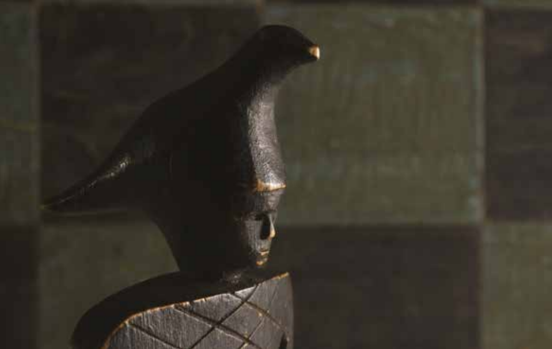
Andlitsmynd av talvfólkinum "rókur". Tjóðsavnið.

listafólkið telgt ein mann við einum fugli á høvðinum. Heitið og útsjóndin hevur flutt seg frá stríðsvagni umvegis ein bygning til ein fuglahatt. Soleiðis flyta mentanarmynstur seg á órannsakandi leiðum.