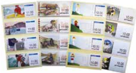
Vign. d'affranchissement de "frankie":