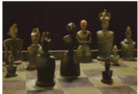
Svært frúgv höttir kong.