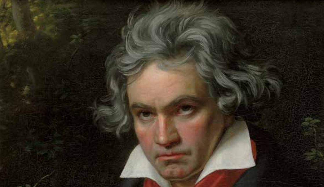
Málningur av Ludwig van Beethoven. Listamaður: Josef Karl Stieler (1781-1858)

10 árin av lívinum, tá hann meir ella minni var stökkdeyvur, skapti hann nøkur av sínum best umtóktu verkum. Eftir langa sjúkralegu, andaðist Beethoven í 1827, 56 ára gamal. Hann telist sum ein av størstu klassisku tónaskøldunum, javngóður við fyrimyndina, Mozart.