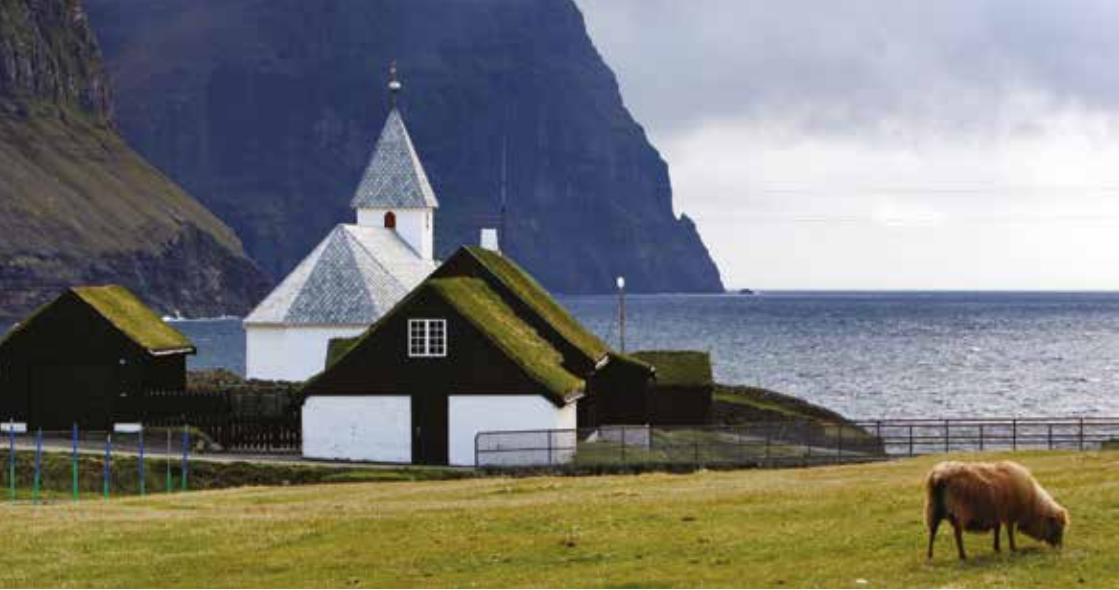
Viðareiðis kirkja.