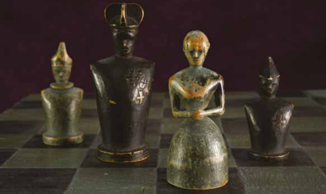
Fýrtalv. Tjóðsavnið.

Frímerkið vísir talvborðið, ið varð brúkt at telva fýrtalv á umframt fýra heimagjørd talvfólk. Ein riddara, ein kong, eina frúgv og ein bisp.