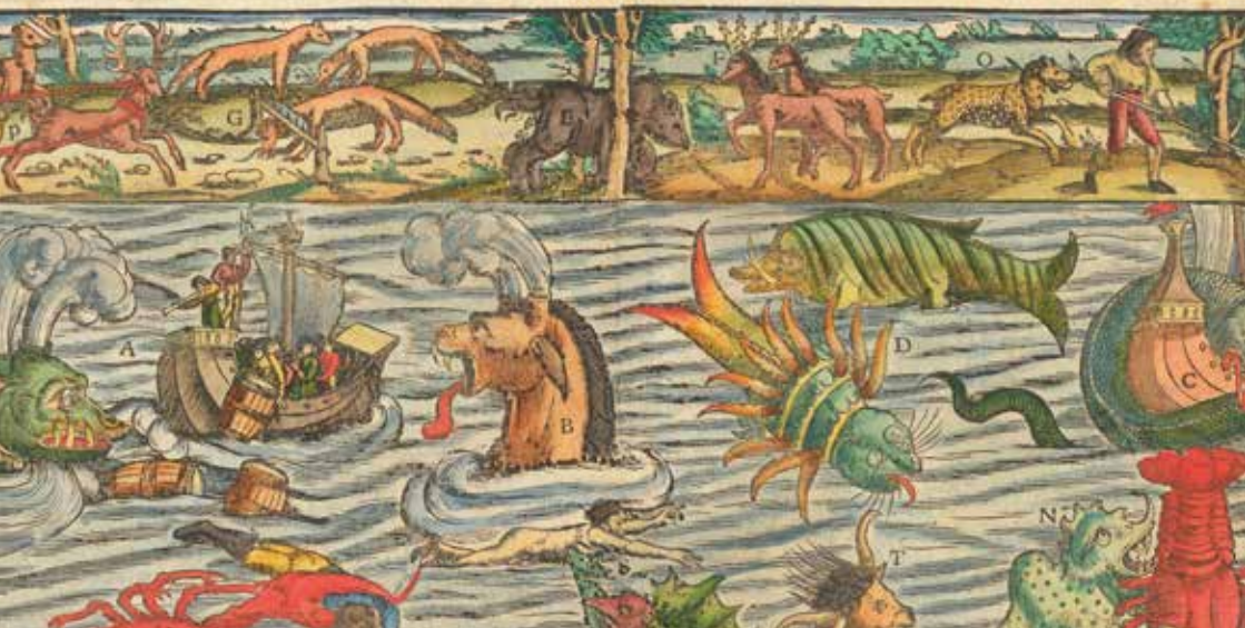
Partur av kortinum, sum visir havdjór og ódjór. Sebastian Münster.

Wunder und seltsame Thier, wie die in den Diana'schen Ländern / im Meer und auff dem Lande gefunden werden.