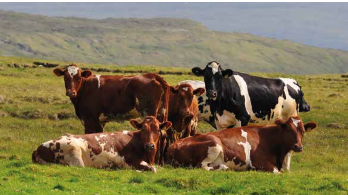
Neyt í haganum á Velbastað.

veturin, gjørdi at tað bar til at savna saman neytamykju og goyma hana í køstinum til várs. Blandað saman við øðrum tøðum, til dømis tara, so slapst undan at útpína moldina.