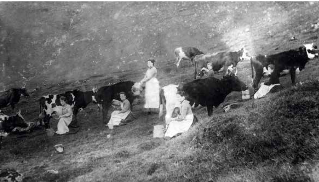
Neytakonur. SNR:3350-2662.

ger at mjólk kann gerast til ost. Heilt fram til 1970'ini høvdu nógvar føroyskar familjur eina kúgv í kjallarunum. Ofta sást tað á børnunum, tá kúgvin hevði kálvað og húsarhaldið aftur fekk mjólk.