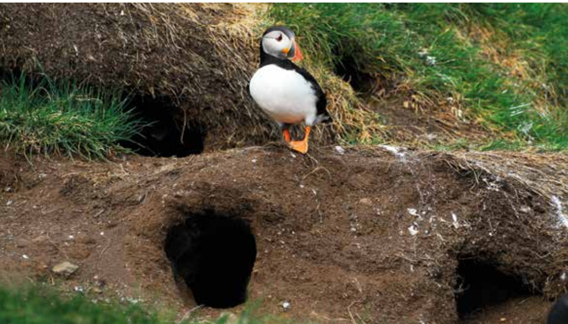
Lundi og lundaholur.

lundalandi einamest fangar ungar lundar og ikki búfuglin, hefur tann nógva veiðan gjøgnum tíðirnar helst verið ov stór. Seinast í 1930'unum vórðu umleið 350.000 lundar fleygaðir árliga.